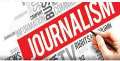
ਪੰਜਾਬੀ ਪ੍ਰੈੱਸ ਕਲੱਬ ਆਫ ਬੀਸੀ Punjabi Press Club of BC