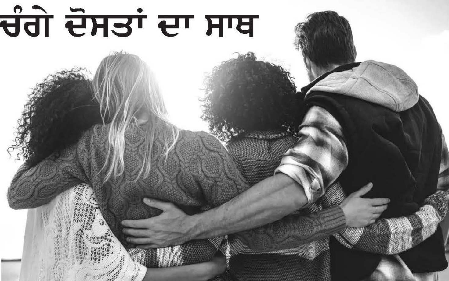
ਦੇ ਸੁਨਿਹਰੀ ਪਲ ਬਣ ਜਾਂਦੇ ਹਨ। ਸਾਡੇ ਜੀਵਨ ਦੀਆਂ ਅਹਿਮ

ਭਰੋਸੇਯੋਗ ਅਤੇ ਪਿਆਰ ਭਰਿਆ ਮੰਨਿਆ ਜਾਂਦਾ ਹੈ। ਇੱਕ ਚੰਗਾ ਦੋਸਤ ਬਿਪਤਾ ਪੈਣ ਉੱਪਰ ਪਿੱਛੇ ਕਦਮ ਪੁੱਟਣ ਵਾਲਿਆਂ ਵਿੱਚੋਂ ਨਹੀਂ ਹੁੰਦਾ ਬਲਕਿ ਦੁੱਖ ਵਿੱਚ ਮਾਰਗ ਦਰਸ਼ਨ ਕਰਨ ਵਾਲਾ ਹੁੰਦਾ ਹੈ। ਦੋਸਤ ਦੇ ਰੂਪ ਵਿੱਚ ਸਾਨੂੰ ਇੱਕ ਅਜਿਹਾ ਇਨਸਾਨ ਮਿਲਦਾ ਹੈ, ਜਿਸ ਨਾਲ ਅਸੀਂ ਹਮੇਸ਼ਾ ਆਪਣੇ ਦੁੱਖ ਸੁੱਖ ਸਾਂਝੇ ਕਰ ਸਕਦੇ ਹਾਂ, ਬੇਝਿਜਕ ਆਪਣੇ ਦਿਲ ਦੇ ਜਜ਼ਬਾਤ ਇੱਕ ਦੂਸਰੇ ਨਾਲ ਵੰਡ ਸਕਦੇ ਹਾਂ। ਸਾਡੀ ਜ਼ਿੰਦਗੀ ਵਿੱਚ ਦੋਸਤਾਂ ਦਾ ਹੋਣਾ ਬਹੁਤ ਜਰੂਰੀ ਹੈ, ਸਕੂਲ, ਕਾਲਜ ਵਿੱਚ ਪੜ੍ਹਦਿਆਂ ਸਾਡੇ ਦੋਸਤ ਹੀ ਹੁੰਦੇ ਹਨ ਜਿੰਨਾ ਨਾਲ ਉਹ ਪਲ ਸਾਡੀ ਜ਼ਿੰਦਗੀ