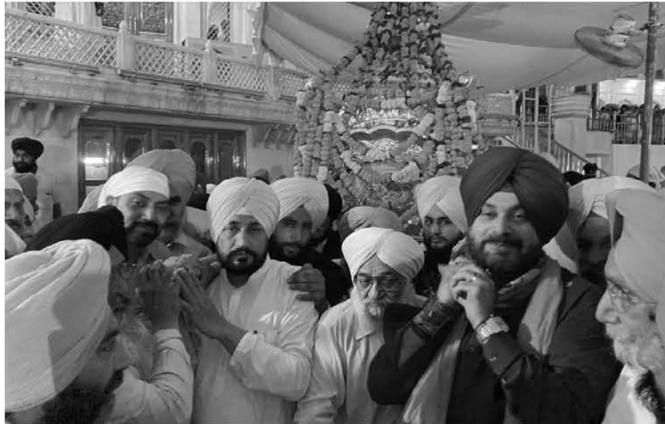
ਕਦੇ ਮਹਿਸੂਸ ਨਹੀਂ ਕੀਤੀ ਹੈ। ਉਨ੍ਹਾਂ ਕਿਹਾ ਕਿ ਕਾਂਗਰਸ ਸਰਕਾਰ ਹੁਣ ਨਿਰਭੇ ਅਤੇ ਨਿਯਤਕ ਹੋ ਕੇ ਲੋਕਾਂ ਦੀ ਸੇਵਾ ਕਰ ਸਕਦੀ ਹੈ। 'ਹੱਕ-ਸੱਚ ਦੀ ਲੜਾਈ ਵਿਚ ਹਰ ਕਾਂਗਰਸੀ ਸ਼ਾਮਲ ਹੋਵੇਗਾ ਅਤੇ ਇਨਸਾਫ ਲੋਕਾਂ ਦੀ ਅਦਾਲਤ ਵਿਚ ਹੋਵੇਗਾ।' ਇਸ ਤੋਂ ਪਹਿਲਾਂ ਮੁੱਖ ਮੰਤਰੀ ਅਤੇ ਹੋਰ ਆਗੂਆਂ ਨੇ ਤੜਕੇ ਹੀ ਸ੍ਰੀ ਹਰਿਮੰਦਰ ਸਾਹਿਬ ਮੱਥਾ ਟੇਕਿਆ ਅਤੇ ਸ੍ਰੀ ਗੁਰੂ ਗ੍ਰੰਥ ਸਾਹਿਬ ਦੇ ਪ੍ਰਕਾਸ਼ ਵੇਲੇ ਬੀੜ ਨੂੰ ਸੁਖ ਆਸਣ ਵਾਲੇ ਸਥਾਨ ਤੋਂ ਲਿਆਉਣ ਸਮੇਂ ਪਾਲਕੀ ਨੂੰ ਮੋੜਾ ਦਿੱਤਾ। ਉਨ੍ਹਾਂ ਕੁਝ ਸਮਾਂ ਗੁਰਬਾਣੀ-ਕੀਰਤਨ ਵੀ ਸਰਵਣ ਕੀਤਾ। ਮਗਰੋਂ ਸੂਚਨਾ ਕੇਂਦਰ ਵਿਚ ਉਨ੍ਹਾਂ ਨੂੰ ਸ਼੍ਰੋਮਣੀ ਕਮੇਟੀ ਵਲੋਂ ਸਨਮਾਨਿਤ ਵੀ ਕੀਤਾ ਗਿਆ।