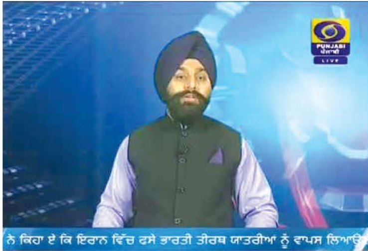
ਨੇ ਕਿਹਾ ਏ ਕਿ ਇਰਾਨ ਵਿੱਚ ਰਸੇ ਤਾਰਤੀ ਤੀਰਥ ਯਾਤਰੀਆਂ ਨੂੰ ਵਾਪਸ ਲਿਆਉਣ

ਪ੍ਰਸਾਰਨ ਪ੍ਰਤੀ ਵਿਸ਼ੇਸ਼ ਆਕਰਸ਼ਨ ਰਹਿੰਦਾ ਹੈ। ਡੀ ਡੀ ਪੰਜਾਬੀ ਦੀ 8-10 ਮਹੀਨੇ ਪਹਿਲਾਂ ਵਾਲੀ ਤਰਸਯੋਗ ਸਥਿਤੀ ਬਿਲਕੁਲ ਬਦਲ