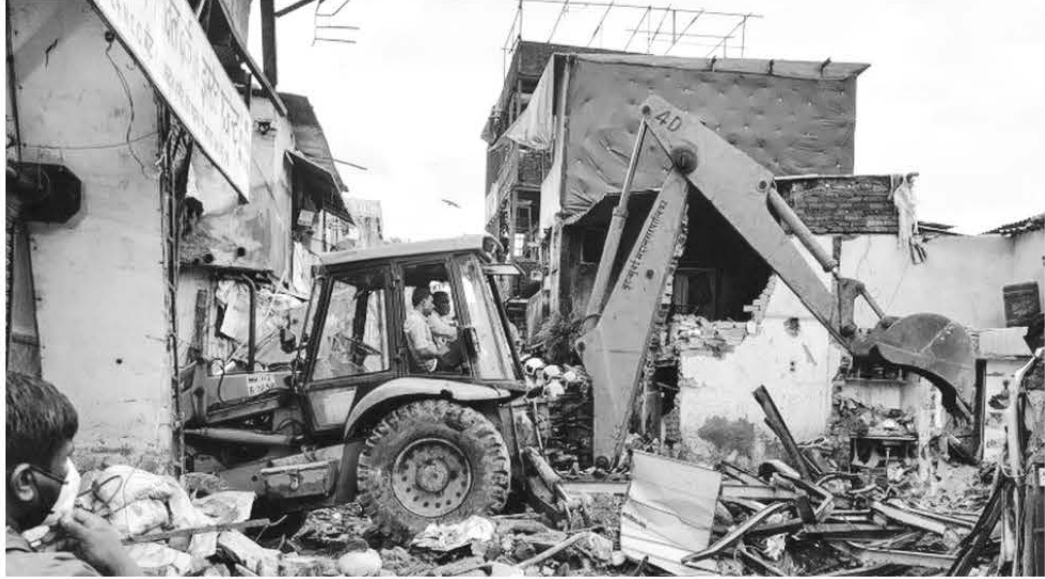
ਬੀਐੱਮਸੀ ਅਧਿਕਾਰੀ ਨੇ ਕਿਹਾ ਕਿ ਹਾਦਸੇ ਮਗਰੋਂ ਫਾਇਰ ਬ੍ਰਿਗੇਡ ਅਤੇ ਹੋਰ ਏਜੰਸੀਆਂ ਮੌਕੇ 'ਤੇ ਪਹੁੰਚੀਆਂ ਅਤੇ ਉਨ੍ਹਾਂ