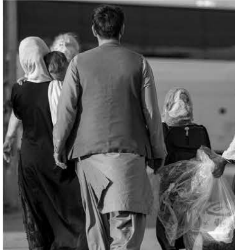
ਨੇ ਪੋਸਟ ਮੀਡੀਆ ਨਿਊਜ਼ ਨਾਲ ਗੱਲਬਾਤ ਕਰਦਿਆਂ ਬਦਲਾ ਲਏ ਜਾਣ ਦੇ ਡਰ ਤੋਂ ਆਪਣੇ ਪਰਿਵਾਰ ਦਾ ਅਸਲ ਨਾਂ ਦੀ ਵਰਤੋਂ ਨਹੀਂ ਕੀਤੀ।