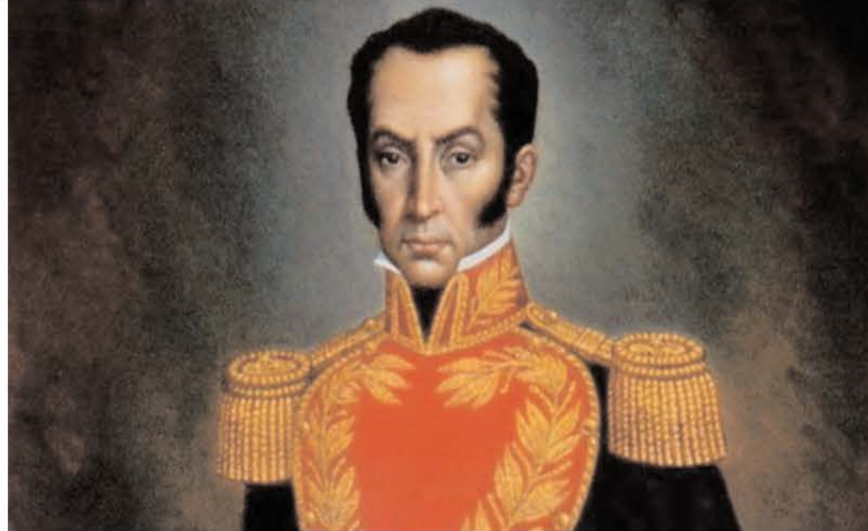
ਬਾਵਜੂਦ ਉਸ ਨੇ ਹੋਸਲਾ ਨਾ ਹਾਰਿਆ। ਆਪਣੀ ਜਬਰਦਸਤ ਇੱਛਾ ਸਖਤੀ ਦੇ ਬਲ 'ਤੇ ਆਖਰ ਉਸ ਨੇ 1821 ਈਸਵੀ ਵਿੱਚ

ਇਹ ਅਦੁੱਤੀ ਕਾਰਨਾਮਾ ਕਰਨ ਵਾਲੇ ਮਹਾਨ ਪੁਰਸ਼ ਸਾਈਮਨ ਬੋਲੀਵਰ ਦਾ ਪੂਰਾ ਨਾਮ ਸਾਈਮਨ ਜੋਸ ਐਂਟੋਨੀਉ ਡੀ ਲਾ ਸੈਨਟਿਜ਼ਮਾ ਤ੍ਰਿਨੀਦਾਦ ਬੋਲੀਵਰ ਪਲੇਸੀਉ ਪੋਂਟੋ ਐਂਡਰੇਡ ਬਲੈਂਕੋ ਸੀ ਤੇ ਉਸ ਦਾ ਜਨਮ 24 ਜੁਲਾਈ 1783 ਈਸਵੀ ਨੂੰ ਕਰਾਕਾਸ ਸ਼ਹਿਰ (ਵੈਨਜ਼ੁਐਲਾ) ਦੇ ਇੱਕ ਧਨੀ ਪਰਿਵਾਰ ਵਿੱਚ ਹੋਇਆ। ਉਸ ਦੇ ਪਿਤਾ ਦਾ ਨਾਮ ਕਰਨਲ ਵਿੰਸੈਂਟ ਬੋਲੀਵਰ ਤੇ ਮਾਤਾ ਦਾ ਨਾਮ ਮਾਰੀਆ ਬਲਾਕੋ ਸੀ। ਉਸ ਸਮੇਂ ਬਰਾਜ਼ੀਲ ਨੂੰ ਛੱਡ ਕੇ ਸਾਰੇ ਦੱਖਣੀ ਅਮਰੀਕਾ 'ਤੇ ਸਪੇਨ ਦਾ ਕਬਜ਼ਾ ਸੀ। 16 ਸਾਲ ਦੀ ਉਮਰ ਵਿੱਚ ਉਸ ਨੂੰ ਉੱਚ ਸਿੱਖਿਆ ਹਾਸਲ ਕਰਨ ਲਈ ਸਪੇਨ ਭੇਜ ਦਿੱਤਾ ਗਿਆ। ਉਸ ਨੇ ਇਸ ਸਮੇਂ ਦੌਰਾਨ ਯੂਰਪ ਦੇ ਕਈ ਦੇਸ਼ਾਂ ਦਾ ਭਰਮਣ ਕੀਤਾ। ਯੂਰਪੀਨ ਦੇਸ਼ਾਂ ਦੀ ਅਜ਼ਾਦੀ ਵੱਲ ਵੇਖ ਕੇ ਉਸ ਦੇ ਦਿਲ ਵਿੱਚ ਵੀ ਦੱਖਣੀ ਅਮਰੀਕਾ ਨੂੰ ਸਪੇਨ ਦੇ ਪੰਜਿਆਂ ਤੋਂ ਅਜ਼ਾਦ ਕਰਾਉਣ ਦਾ ਖਿਆਲ ਅੰਗਤਾਈਆਂ ਲੈਣ ਲੱਗਾ ਤੇ ਸੰਨ 1808 ਈਸਵੀ ਵਿੱਚ ਉਹ ਵਾਪਸ ਵੈਨਜ਼ੁਐਲਾ ਵਾਪਸ ਆ ਗਿਆ। ਉਸ ਸਮੇਂ ਸਪੇਨ ਵਰਾਸ ਨਾਲ ਜੰਗ ਵਿੱਚ ਉਲਝਿਆ ਹੋਇਆ ਸੀ। ਇਸ ਮੌਕੇ ਦਾ ਫਾਇਦਾ ਉਠਾ ਕੇ ਬੋਲੀਵਰ ਨੇ ਆਪਣਾ ਸੁਤੰਤਰਤਾ ਸੰਗਰਾਮ ਸ਼ੁਰੂ ਕਰ ਦਿੱਤਾ।