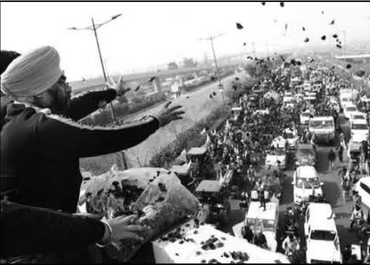
ਸਰਕਾਰੀ ਟਰੈਕਟਰ ਪਰੇਡ ਵਿੱਚ ਸ਼ਾਮਲ ਟਰੈਕਟਰਾਂ ਦੀ ਗਿਣਤੀ ਦੱਸਦੇ ਹਨ ਕਿ ਤਿੰਨ ਲੱਖ ਟਰੈਕਟਰ ਸ਼ਾਮਲ ਹੋਇਆ ਅਤੇ ਹਰ ਟਰੈਕਟਰ ਉੱਪਰ ਪੰਜ ਤੋਂ ਵੱਧ ਜਣੇ ਬੈਠੇ ਸਨ।